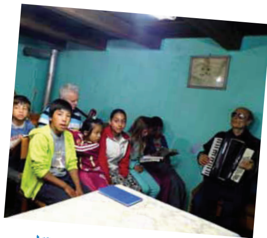
'Zing voor de Heer...'